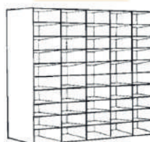
VERSION 3 H : 108cm L : 134cm l : 35cm Jusqu'à 50 cases