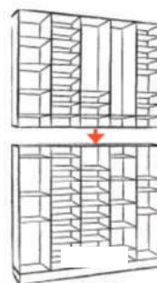
VERSION 1 H : 212cm L : 134cm l : 35cm Livré en deux modules