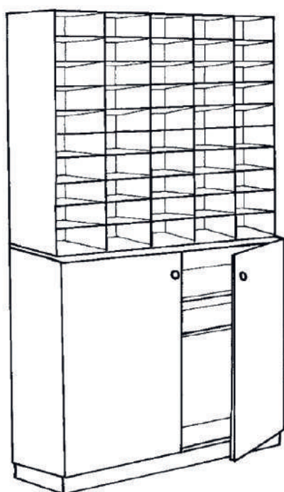
VERSION 2 H : 212cm L : 134cm l : 40cm Jusqu'à 50 cases